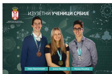
Међународна олимпијада из математике, Велика Британија