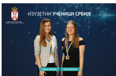
Међународна математичка олимпијада за девојке, Кијев